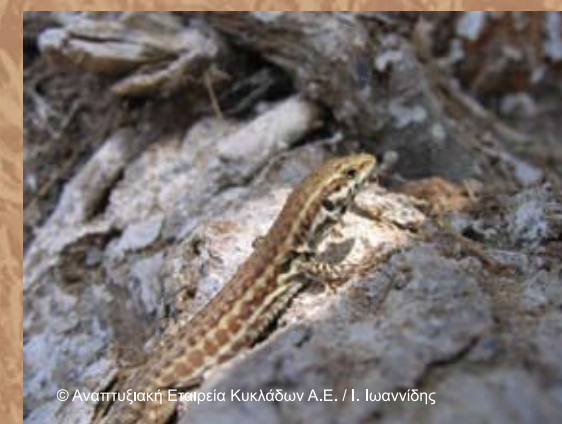
Σαύρα της Μήλου ( Podarcis milensis )