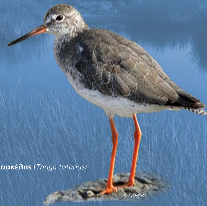
Κοκκινοσκέλης ( Tringa totanus )