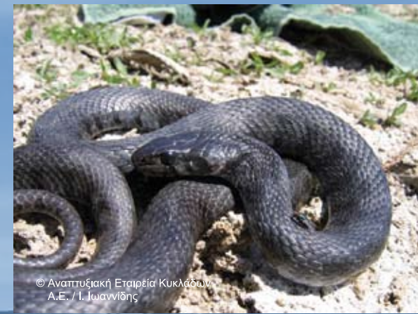
Νερόφιδο ( Natrix natrix schweizeri )