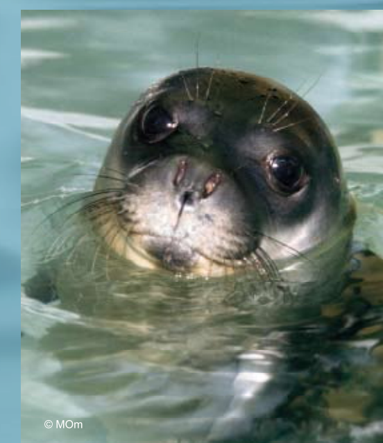
Μεσογειακή φώκια ( Monachus monachus )