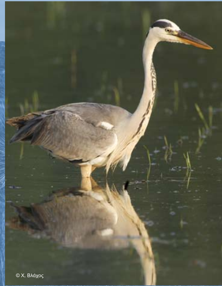
Σταχτοσκηνιάς ( Ardea cinerea )