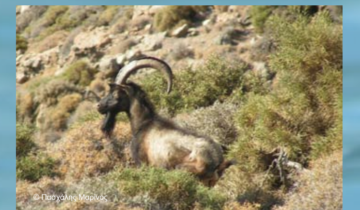
Αγριοκάτσικο της Αντιμήλου ( Capra aegagrus )