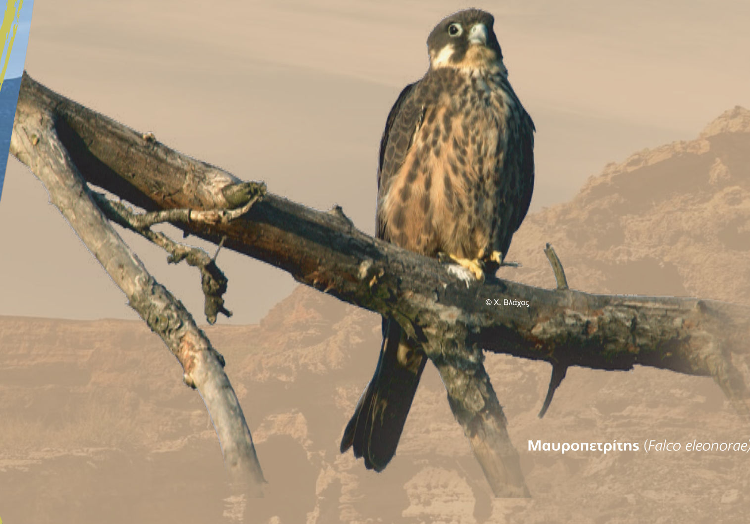
Μαυρονετρίτης ( Falco eleonorae )