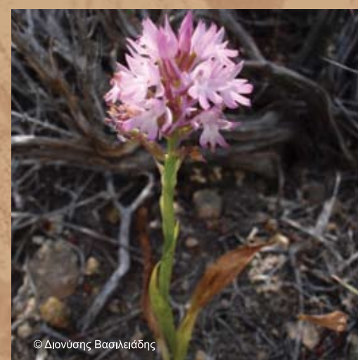
Ορχιδέα η πυραμιδοειδής ( Anacamptis pyramidalis )