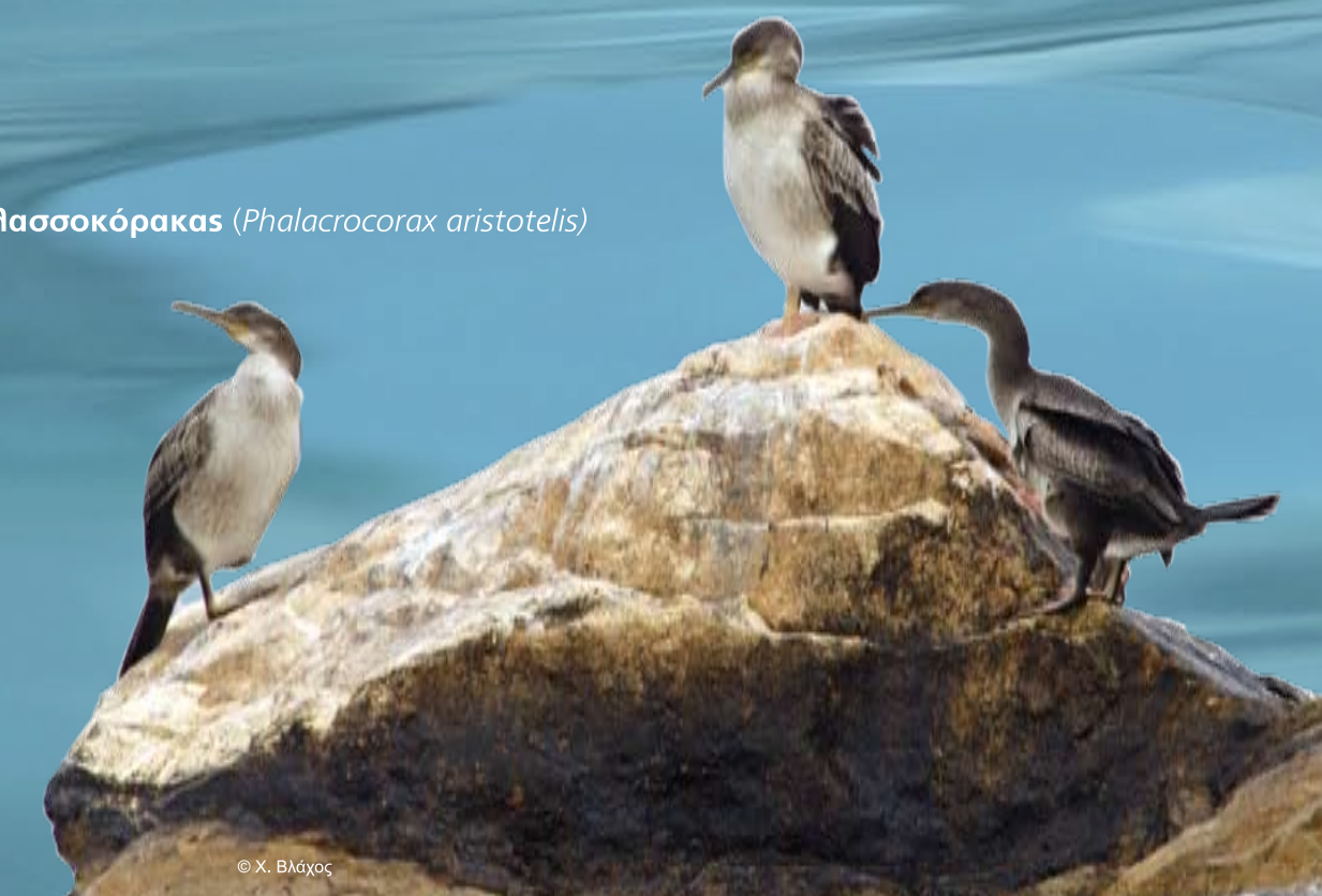
Θαλασσοκόρακας ( Phalacrocorax aristotelis )