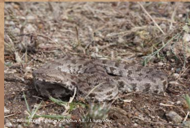
Οχιά της Μήλου ( Macrozipera schweizeri )