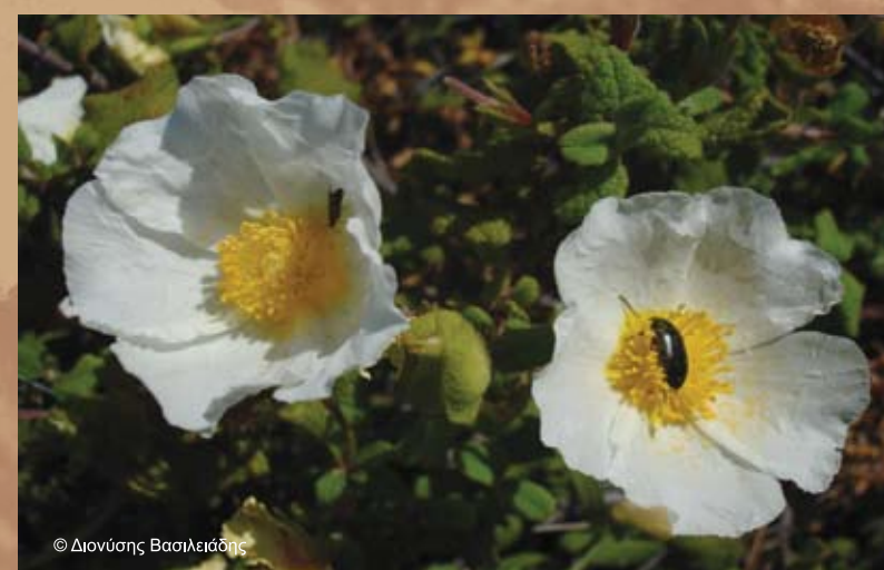
Λαδανιά ( Cistus salviifolius )